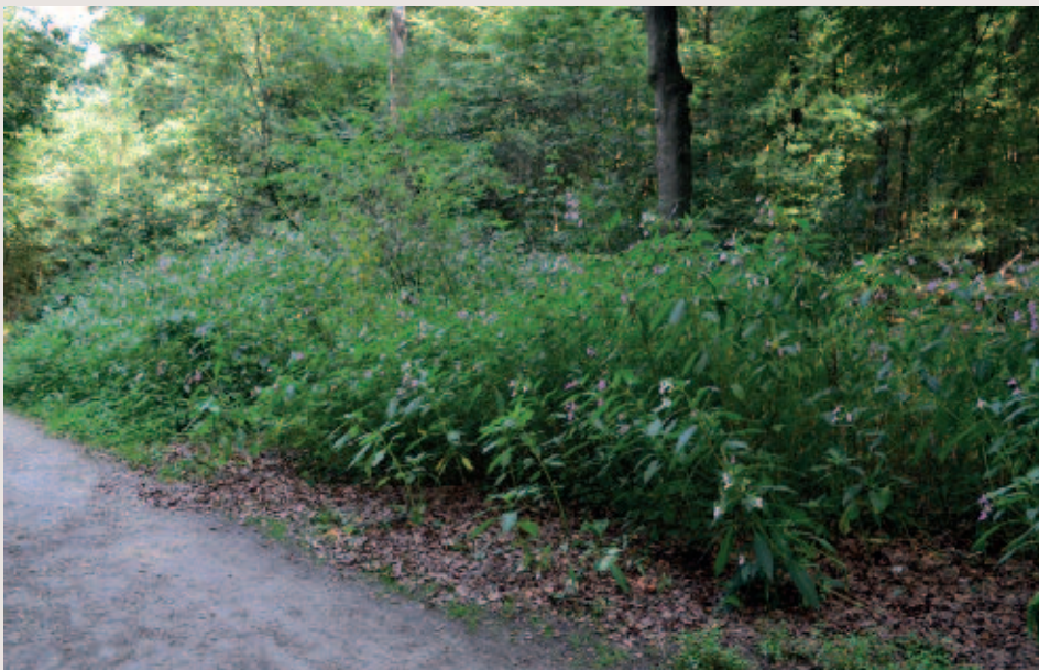
Foto 2. Dominantie van vegetatie door reuzenbalsemien ( Impatiens glandulifera ) langs de rand van het Groesbeekse bos.

ruigten, bos- en struweelranden (foto 2). Dit zijn vaak plekken waar door natuurlijke dynamiek of antropogene verstoring geen gesloten vegetatie aanwezig is. Binnen Nederland komt deze soort al voor in 61 Natura 2000 gebieden die vooral in beekdalen en langs grote rivieren liggen (foto 3). De snelle verspreiding en massale vestiging langs beken en in rivieruiterwaarden is gerelateerd aan de overstromingsdynamiek. Reuzenbalsemien groeit vaak op plekken waar tijdens overstromingen voedselrijk slib bezinkt (Seeney, 2016). Na het groeiseizoen sterven deze éénjarige planten volledig af. Hierdoor ontstaan kale bodems en oevers die bij hoge waterafvoer tijdens het winterseizoen eroderen en waarop deze exoot zich vervolgens weer gemakkelijk uit zaad kan vestigen.