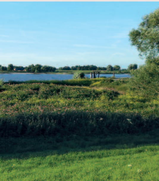
Foto 4. Groei van reuzenbalsemien door onvolledig verwijderen van plantenmateriaal na maaien van bronbeekoevers in Beek-Ubbergen.

Momenteel is onvoldoende informatie beschikbaar over de effectiviteit van biologische bestrijdingsmethoden van uitheemse springzaden (Matthews et al., 2015). De eerste veldexperimenten voor bestrijding van reuzenbalsemien met