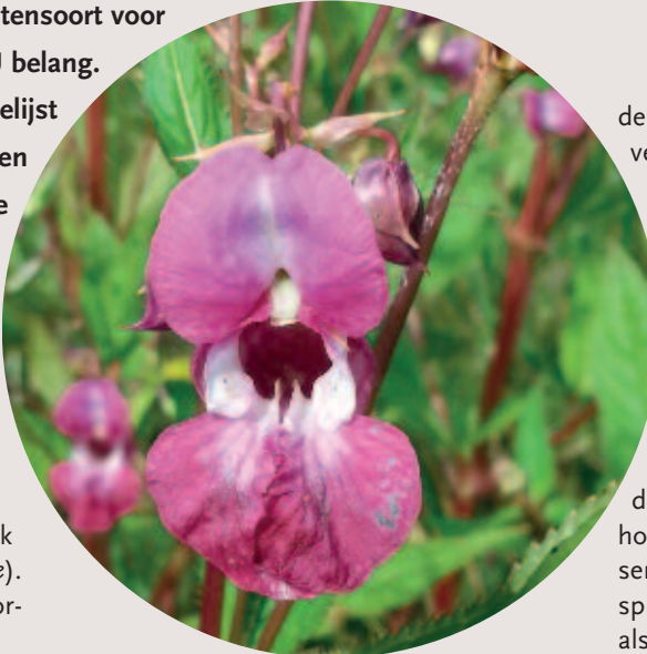
Foto 1. Nectarrijke bloem van de reuzenbalsemien ( Impatiens glandulifera ).

Nederland en België huisvesten slechts één inheemse springzaadsoort, namelijk groot springzaad ( Impatiens noli-tangere ). Tenminste 24 uitheemse springzaadsoorten worden als plant of zaad in Europa verhandeld (Matthews et al., 2015). Gelet op hun klimaat- en habitateisen kunnen zich hiervan 13 soorten in Nederland vestigen (tabel 1) en zeer waarschijnlijk ook in België. Van deze 13 soorten hebben zich al vier soorten in het wild gevestigd: tweekleurig springzaad ( Impatiens balfourii ), oranje springzaad ( Impatiens capensis ), reuzenbalsemien (foto 1) en klein springzaad ( Impatiens parviflora ). In stedelijke gebieden is recent ook verwildering van ruig springzaad ( Impatiens cristata ), bont springzaad ( Impatiens edgeworthii ) en