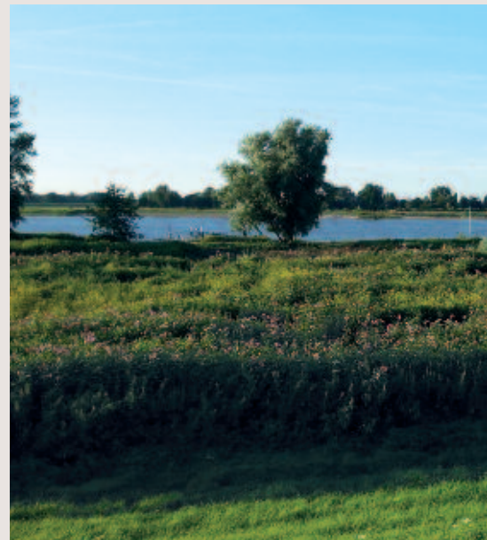
Foto 3. Reuzenbalsemien domineert de vegetatie (donkergroene plekken met paarse bloemen) in grote delen van de Beuningse uiterwaarden langs de Waal.

Slechts enkele plantensoorten, zoals de uitheemse Japanse duizendknoop ( Fallopia japonica ) met een sterke vegetatieve vermeerdering en dicht wortelstelsel (Oldenburger & Penninkhof, dit nummer), weerstaan de concurrentie van reuzenbalsemien. De soort wordt ook weinig gegeten door herbivoren. Bladeren worden gemineerd door larven van de mineervlieg Phytoliriomyza melampyga , die alleen voorkomen op het geslacht Impatiens (www.bladmineers.nl). Deze vlieg heeft sterk geprofiteerd van de uitbreiding van springzaadsoorten en komt nu in heel Nederland voor. Hij houdt echter de springzaden door zijn geringe bladschade niet in toom. Dominantie door reuzenbalsemien verandert de vegetatiestructuur en leidt tot monospecifieke vegetaties (Hejda & Pyšek, 2006). Hierdoor vermindert de faunadiversiteit (Tanner, 2011). Hoge en dichte bestanden langs beken en kleine rivieren beschaduwden oeverbiotopen, waardoor ook aquatische habitatfuncties