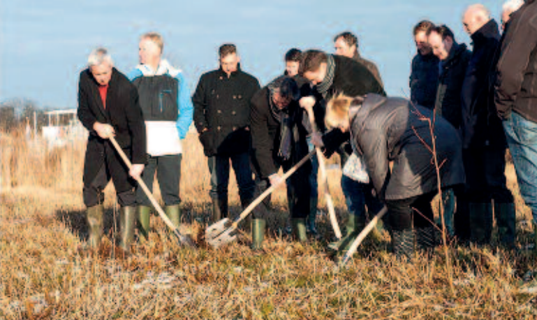
Foto 1. Vertegenwoordigers van de partners/financiers (mét toezichhouders) bezig met het eerste plagwerk in een sterk vervuurd veenmosriet-land.

getroffen. Het betreft vroegere poldertjes, die tientallen jaren geleden zijn verlaten en vervolgens onder water zijn gelopen. Hier van zijn de oude polderkades hersteld en zijn kleine windmolens geplaatst. De gebieden zijn nu droog gemalen, waarna in het 1e jaar na droogval een uitgebreide vegetatie van Grote lisdodde ( Typha latifolia ), Riet ( Phragmites australis ) en pioniers als Gele waterkers ( Rorippa amphibia ) is ontstaan (foto 2&3). Zodra de gebieden geschikt zijn als broedgebied voor de Roerdomp en andere soorten van waterriet, dan worden de poldertjes opnieuw aangesloten op de Friese boezem. De beheerder houdt de mogelijkheid om bij een sterk teruglopende kwaliteit van het waterriet tijdelijk weer over te gaan op lagere peilen of totale droogval.