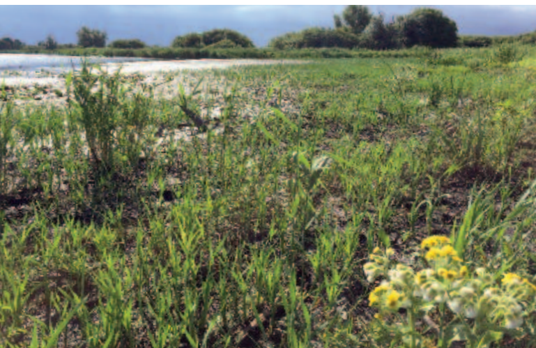
Foto 2. De kracht van peildynamiek: na droogval in begin 2016 is in het volgende groeiseizoen sprake van snelle opkomst van helofyten (vooral Grote lisdodde en Riet) en pioniers (rechtsonder Moerasandijvie).

De in het verleden rijkelijk voorkomende vegetaties van ondergedoken waterplanten zijn met de eutrofiëring en de daarmee gepaard gaande sterke verandering van de vispopulatie ('verbraseming') vrijwel volledig verdwenen. In dit Life-project wordt over een oppervlakte van ca. 80 ha gewerkt aan de terugkeer daarvan. Het betreft een aantal grotere en kleinere petgaten, die verspreid over het gebied liggen en die geïsoleerd zijn van het omringende (voor recreanten bevaarbare) boezemwater of daar relatief gemakkelijk van zijn te isoleren. De belangrijkste maatregel is hier het groten-deels wegvangen van (bodemwoelende en plankton-etende) vis, waarvan Brasem ( Abramis brama ) de hoofdmoot vormt.