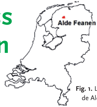
Fig. 1. Ligging van de Alde Feanen.

Het Nationaal Park de Alde Feanen, in het hart van de provincie Fryslân (fig. 1), is met zo'n 2.500 ha verreweg het grootste laagveenmoerasgebied van de provincie en één van de grootste van Nederland. Vanwege het grote belang voor moerasvegetaties en moerasfauna maakt de Alde Feanen deel uit van het Europese Natura 2000-netwerk. Het gebied is van belang voor onder meer veenmosrietland, blauwgrasland, Roerdomp ( Botaurus stellaris ), Noordse woelmuis ( Microtus oeconomus ), Meervleermuis ( Myotis dasycneme ), Otter ( Lutra lutra ) en grote aantallen doortrekkende en overwinterende watervogels.