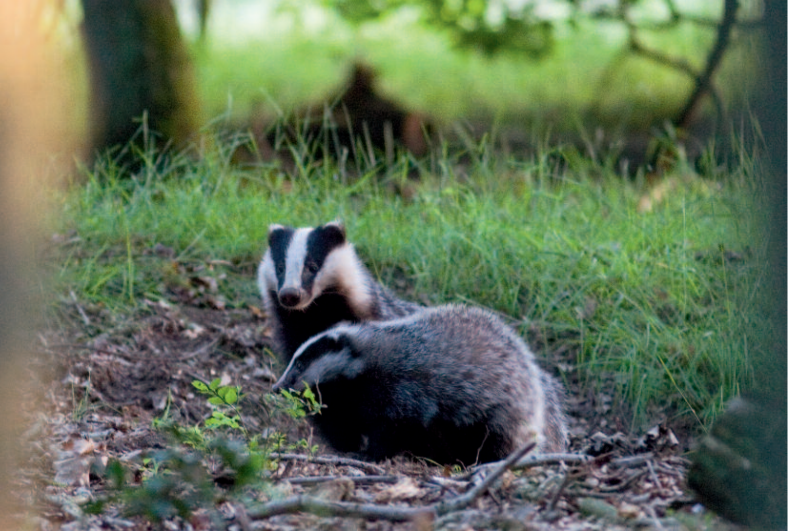
Das ( Meles Meles ).