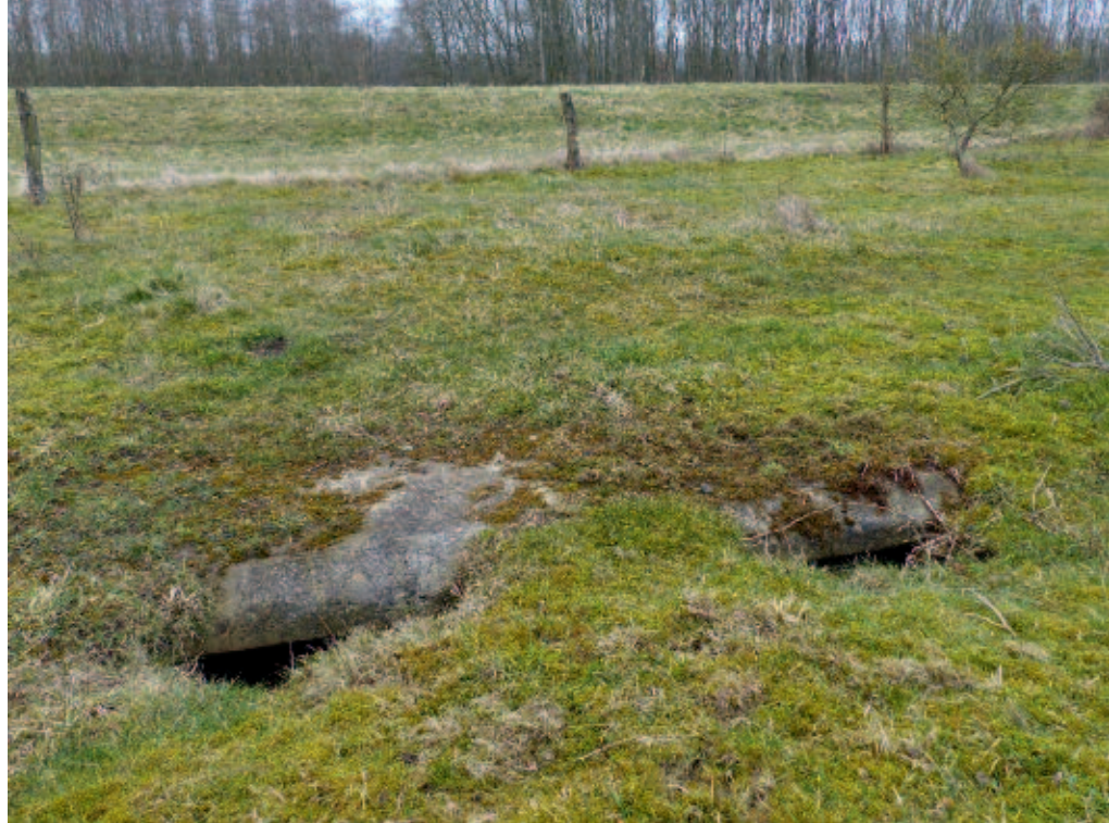
Foto 1. Tijdelijk dassenverblijf onder betonnen platen in de IJssel- uiterwaarden bij Windesheim, Zwolle.

Het landschap is de afgelopen eeuw ingrijpend veranderd. Het is nauwelijks meer voor te stellen hoe nat en gevarieerd Overijssel moet zijn geweest vóór de introductie van kunstmest, prikkeldraad en de grootscheepse hydrologische aanpassingen in het landschap. Door intensivering van de landbouw zijn veel landschapselementen, zoals houtwallen en bosjes, verdwenen en extensieve weilanden vervangen door zwaar bemeste raaigrasakkers. Ruimtelijke ontwikkeling zorgde bovendien voor een sterk versnipperd landschap doorsneden met een dicht netwerk van wegen en uitdijende steden en dorpen. In de jaren '80 rees dan ook de vraag of er in dit grootschalige, versnipperde landschap nog wel ruimte was voor een levensvatbare dassenpopulatie. De Das werd door velen beschouwd als een kwetsbare, uiterst mensenschuwe, kritische soort die hoge eisen stelt aan zijn leefomgeving. De Das gold als een conservatief dier met vaste gewoontes en als indicatorsoort van het kleinschalige cultuurlandschap (Creemer et al., 1991; Dienst Regelingen, 2012; Dirkmaat, 2006; Wiertz & Vink, 1992; Piza Roca et al., 2014). Gezien de dramatische toestand