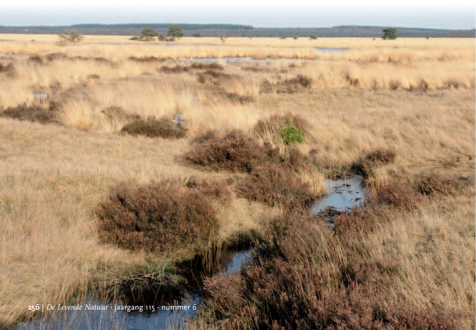
Foto 3. De heidebeek IJzeren Man was afgedamd door een kade met fietspad. Na het verwijderen van deze kade stroomt er weer water door de beek. De Pijpenstrootjebegroeiing ( Molinia caerulea ) en plas op de achtergrond geven min of meer de verbreiding weer van slecht doorlatende bodemlagen, terwijl de Fijn-schapengrasvegetatie ( Agrostis vinealis ) op de voorgrond juist wijst op de afwezigheid van zulke lagen.

Ook nabij de Kronkelweg en het jachthuis Sint Hubertus (Veentjeswei) werden in de winter van 2013-2014 herstelmaatregelen uitgevoerd. In de Veentjeswei was zand