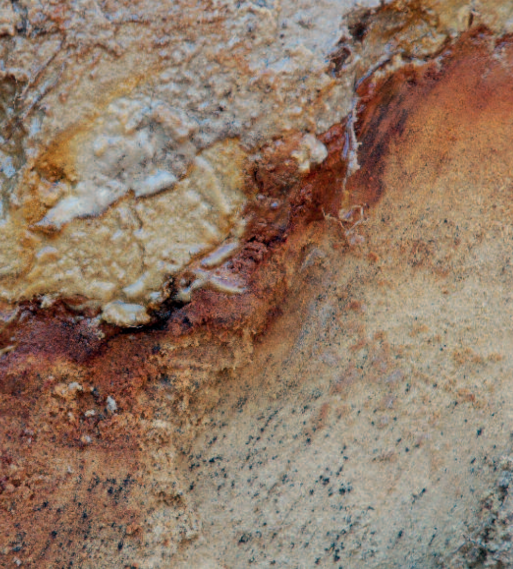
Foto 2. Een placic B horizont (donker roestrood door ijzer) in de Wolfskuilen in het Deelense veld waarboven water stagneert, terwijl de onderzijde droog is.

dun, hard en heel slecht doorlatend ijzerbandje, dat ontstaat bij waterstagnatie op de overgang van fijn zand of leem (met overwegend kleine poriën) naar grindhoudende grove zanden (met grote poriën). Niet alleen grof op fijn, maar ook fijn op grof leidt tot waterstagnatie, en dat laatste is hier het geval. Die waterstagnatie leidt tot afvoer van ijzer uit de bovengrond (in gereduceerde vorm) en de neerslag van ijzer in het onderliggende grove materiaal, waar in de grote poriën zuurstof aanwezig is. Is het dekzand of stuifzand te dik (meerdere meters), of juist te dun (minder dan 1 meter), dan wordt geen placic gevormd. Overigens komt die placic ook veel voor in begraven podzolen, oorspronkelijk gevormd in een dunne laag dekzand over oudere grindrijke afzettingen. De placic zit dan in de onderzijde van de podzol B horizont en deze combinatie is bijzonder ondoorlatend. Van oorsprong waren de vijvers bij jachthuis Sint Hubertus vennen, ontstaan door stagnatie op zo'n placic. Vandaar ook dat ze reddeloos verloren gingen bij doorgraving van die stagnerende laag, maar resten zoals in de Veentjeswei lijken nog steeds te functioneren (Eysink et al., 2013). In het Deelense veld, waar een relatief dunne laag dekzand op licht naar het