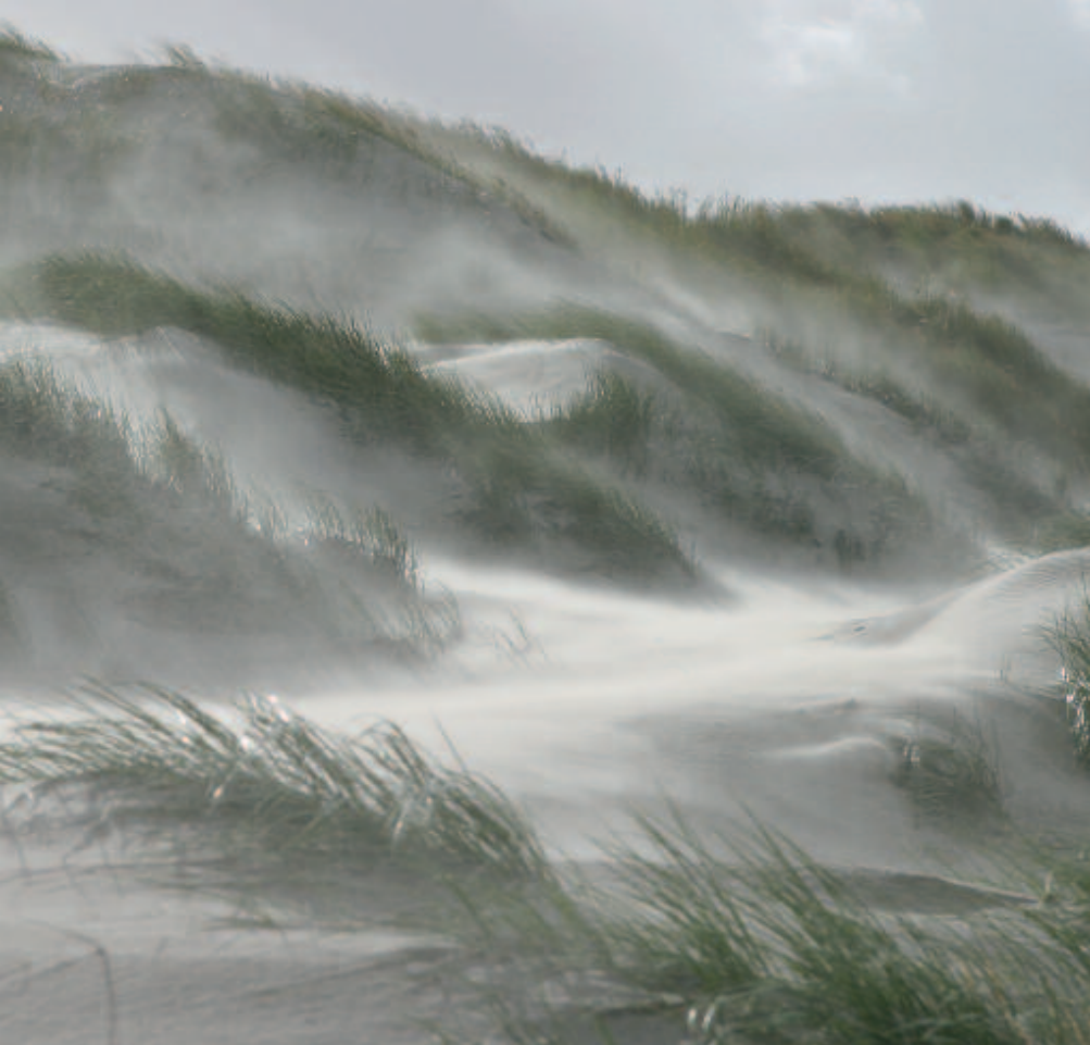
Foto 1. Duinvorming aan de kust is een landschapsvormend proces, van groot belang voor behoud van de diversiteit van de duinen.

te kunnen geven op deze vraag zijn deskundigen van Staatsbosbeheer bevestigd op kwaliteit en perspectief van de natuurgebieden in de EHS. Daarbij is gebruik gemaakt van een eerdere strategische studie (kader 1). Dit leidt tot een analyse van de gehele EHS en een antwoord op de vraag hoe een vitaal natuurnetwerk van natuurgebieden de toekomst in kan gaan. Bij de analyse is exclusief gekeken naar het ecologische toekomstperspectief. Dat staat los van het feit dat een natuurgebied ook een grote (inter)nationale maatschappelijke of cultuurhistorische waarde kan hebben.