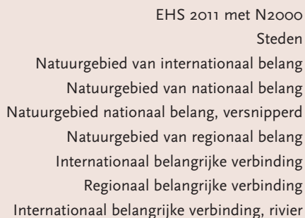
Fig. 1. Kaart met de landschappelijke samenhang van de EHS (2011).

begrenzing van gebieden. Daarbij gaat het niet alleen om een ongunstige lengte-breedte verhouding, maar ook om aanpassingen om hydrologische redenen (Streefkerk & van Gerven, 2013). Voor gebieden in beheer bij Staatsbosbeheer is door Streefkerk & van Gerven beschreven welke percelen in en rond de EHS essentieel zijn voor het hydrologisch functioneren van natuurgebieden. De waterhuishouding is vrijwel altijd belangrijk voor het behoud en de ontwikkeling van gradiënten in de Nederlandse natuurgebieden. De analyse is uitgevoerd voor beleidsmatig belangrijke categorieën natuurgebieden: N2000 en gebieden van nationaal belang (TOP-gebieden), waarbij gebruik is gemaakt van het bestand Natuurmeting op kaart 2010. Geconcludeerd wordt dat voor het hydrologisch functioneren van deze natuurgebieden voor 26000 ha functiewijziging nodig is, waarvan 18500 ha voor Natura2000 gebieden. Op nationale schaal zou (bij benadering) een verdubbeling gelden: 50- tot 60.000 hectare van de essentiële hydrologische buffergebieden ligt buiten de EHS.