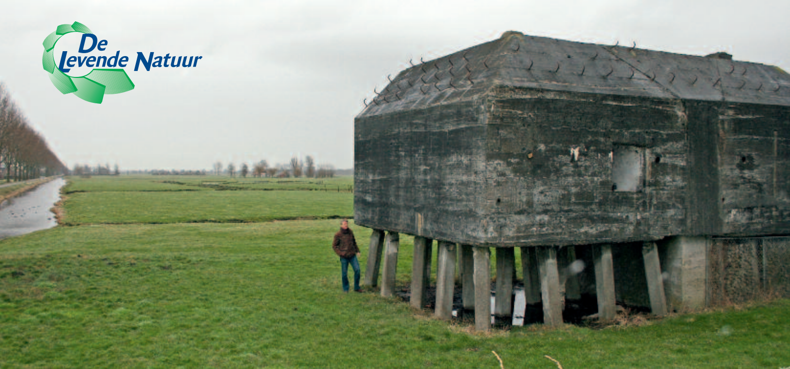
Foto 2. Een groepsschuilplaats bij Tienhoven. De ruimte onder het gebouw geeft een goede indruk van de maaiveldvaling sinds de ontginning van de Bethunepolder rond 1870. Het veen is verdwenen door ontginning, klink en veraarding.

hun ligging, ingeklemd tussen de zee en grote steden, kan hier minder gebruik gemaakt worden van natuurlijke processen. Er zijn ook enkele grote regio's met overwegend kleine natuurgebieden van regionale betekenis: de zeekleigebieden, delen van het laagveengebied en de veenkoloniale zandgronden.