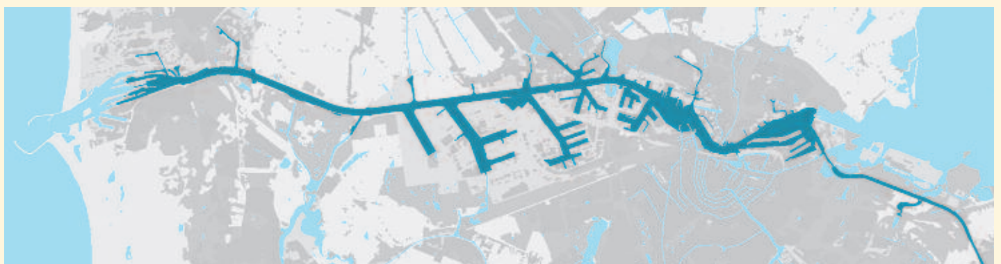
Fig. 2. Het Amsterdamse water is een belangrijke route voor trekvis (tekening DRO, Amsterdam).