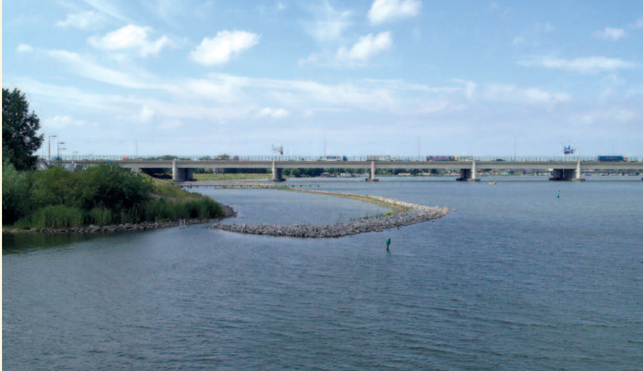
Foto 2. Ter hoogte van IJburg zijn in het Bovendiep een reeks van paaiplaatsen met riet en stortsteen voor vis aangelegd.